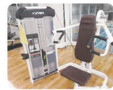
オーバーヘッドプレス