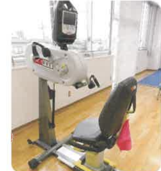
アッパーボディーサイクル